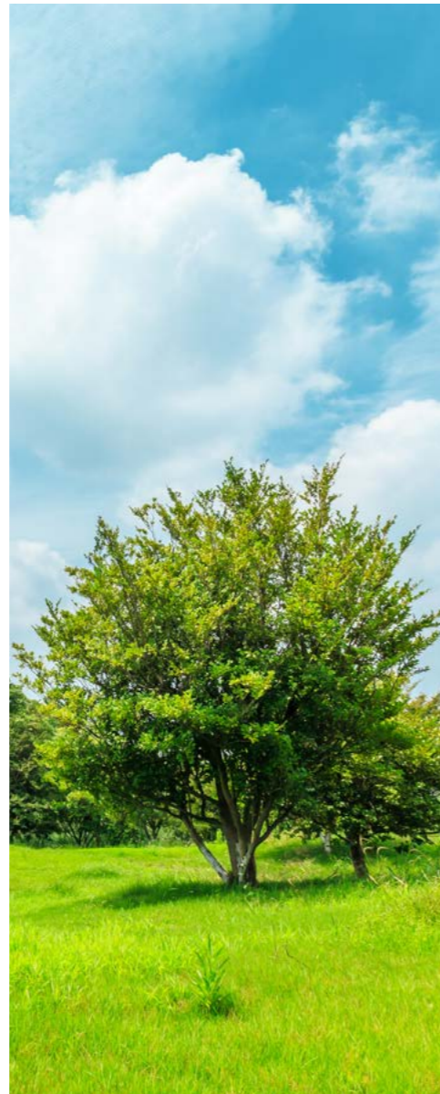
Ökologie, globaler Handel, Arbeitswelt: Wie nachhaltig ist die deutsche Wirtschaft wirklich?

◀ Unsere empirische Befragung spricht eine klare Sprache: Die Wirtschaft lehnt fast unisono die komplette EU-Regulierung ab und empfindet diese als aufwendige Drangsalierung. Das Lieferkettensorgfaltspflichtengesetz wurde eingeführt, weil nicht einmal ein Fünftel der deutschen Unternehmen die Vorgaben des „Nationalen Aktionsplans Wirtschaft und Menschenrechte 2016“ eingehalten hatten. Da darf man bezweifeln, dass Freiwilligkeit funktioniert. Sicherlich sind einige Regulierungen zu detailverliebt und erzeugen unnötigen Aufwand. Generell sollte aber zumindest für größere Unternehmen ein Berichtswesen über finanzielle Daten